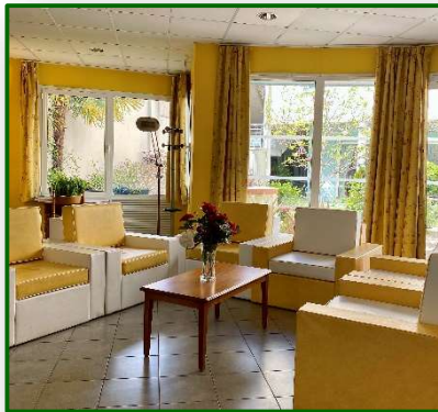
Salon jaune à l'accueil